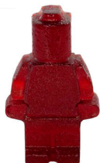
Molde de silicona personaje LEGO (3).jpg